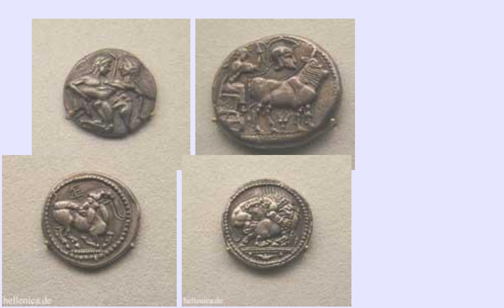
Θάσος Στατήρας , Δέρρονες Δωδεκάδραχμο, Αιγαί ή Δέρρονες Στατήρας, Άκανθος Τετράδραχμο ,