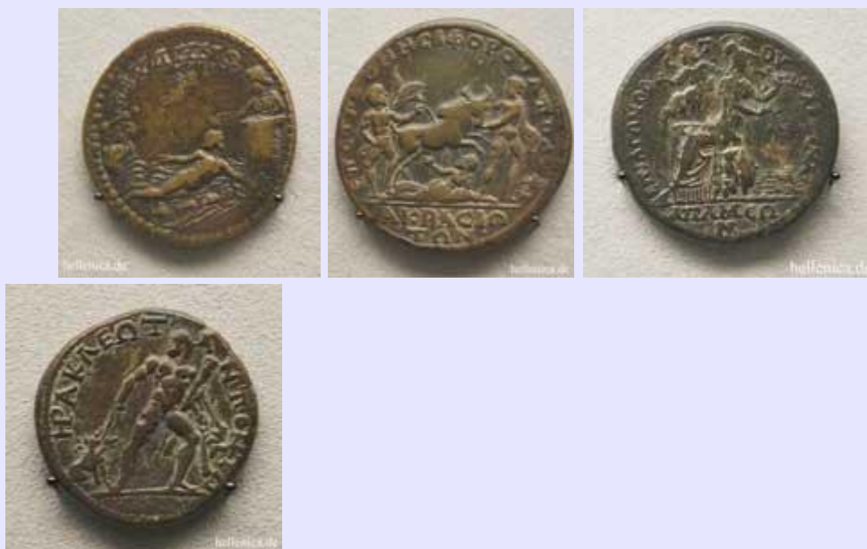
Άβυδος, Ήρω και Λεάνδρος, Άκρασος, Δίρκη, Απάμεια, Αθηνά και Μαρσύας, Ηράκλεια, Ηρακλής και Κέρβερος,