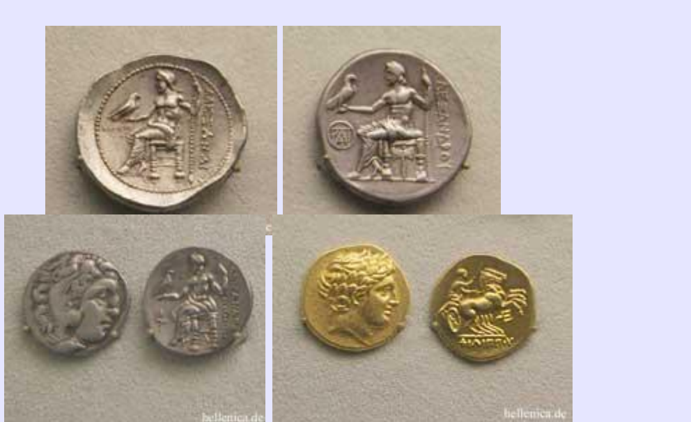
Τετράδραχμο, Τετράδραχμο Μίλητος, Δραχμή Σάρδεις, Φίλιππος Β' Αμφίπολη Στατήρας,