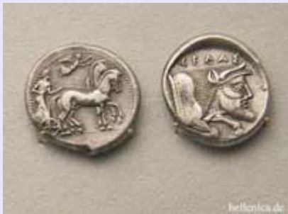
Ρόδος Τετράδραχμο, Ακράγας Τετράδραχμο, Γέλα Τετράδραχμο,