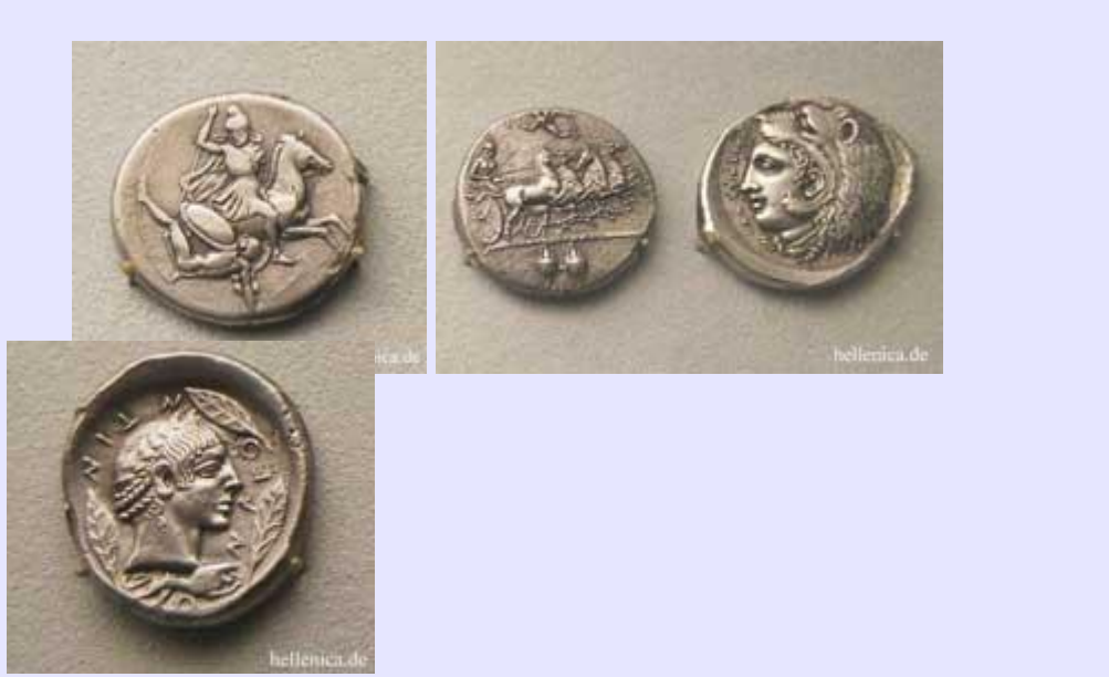
Γέλα Δίδραχμο, Καμάρινα Τετράδραχμο, Λεοντίνοι Τετράδραχμο,