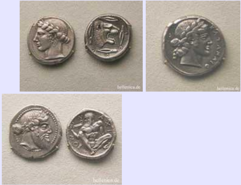
Λεοντίνοι Τετράδραχμο, Κατάνη Τετράδραχμο, Νάξος Μεγάλη Ελλάδα Τετράδραχμο,