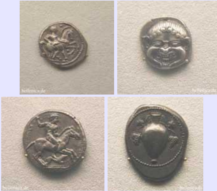
Ιχναί Στατήρας , Νεάπολη Στατήρας , Σερμύλη Τετράδραχμο , Τερόνη Τετράδραχμο ,