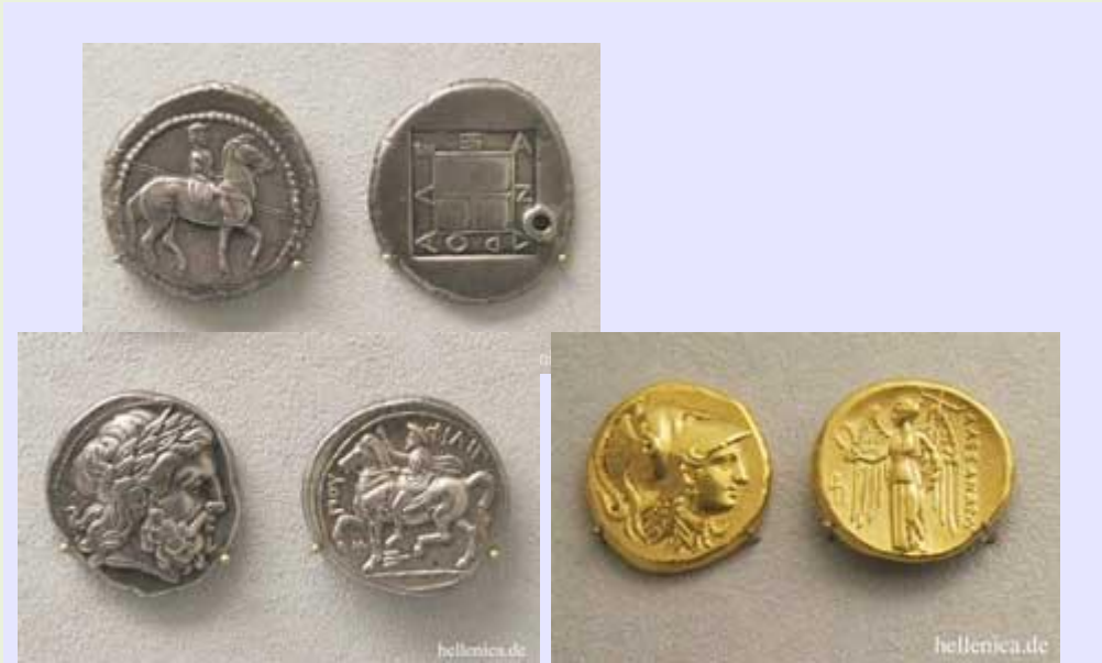
Οκτάδραχμο Αλέξανδρος Α' , Τετράδραχμο Αμφίπολη , Δισατήρας Αμφίπολη ,