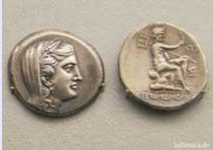
Ίλιον Έκτορας, Ιος, Όμηρος Δίδραχμο, Βυζάντιο Τετράδραχμο,