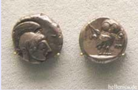
Χαλκίς Τετράδραχμο, Ερέτρια Τετράδραχμο, Αθήνα Τετράδραχμο,