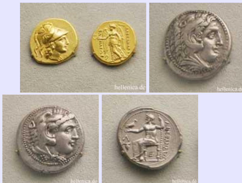
Σατήρας Άραδος , Τετράδραχμο Πέλλα , Τετράδραχμο Δαμασκός , Τετράδραχμο Αμφίπολη ,