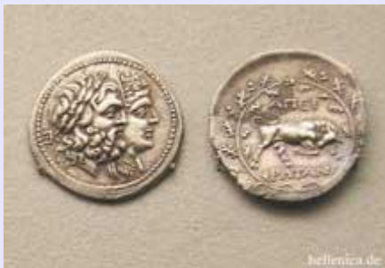
Θεσσαλική Συμμαχία, Αχαϊκή Συμμαχία, Ηπειρωτική Συμμαχία,